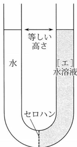
図1 中央部をセロハンで仕切られたU字管の左右に入れられた水と [ エ ] 水溶液の初めの状態

図1のように、U字管の中央部をセロハンで仕切り、左側には水を入れ、右側には [ エ ] 水溶液を入れて、左右等しい高さとする。分子量の小さい水分子はセロハンを通して行き来できるが、分子量の大きい [ エ ] 分子はセロハンを通過できない。このように、溶液中のある成分のみが通過できる膜を [ ケ ] とよぶ。そして、この状態からしばらく放置すると、