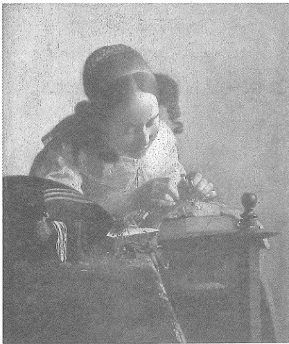
図3 《レースを編む女性》 ルーヴル美術館