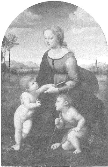
図1 《聖母子と幼き洗礼者聖ヨハネ》 ルーヴル美術館

美術作品には、その作品が制作された時代や地域の特徴が、独特の表現となってあらわれているのを見出すことができる。図1～4はどれも、作品の生み出された背景をよく反映しており興味深い作例である。